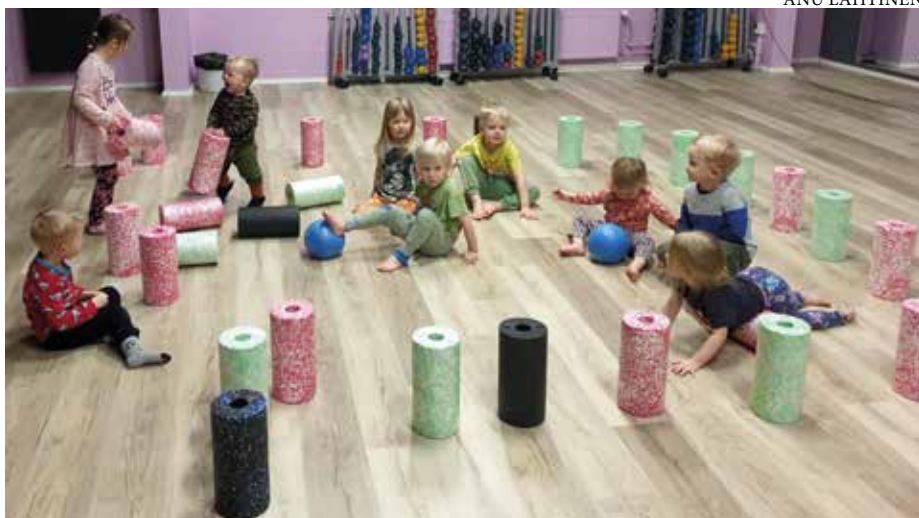
Yksityisessä perhepäivähoidossa olevat lapset tekevät linnoitusta Buugin jumpassa.