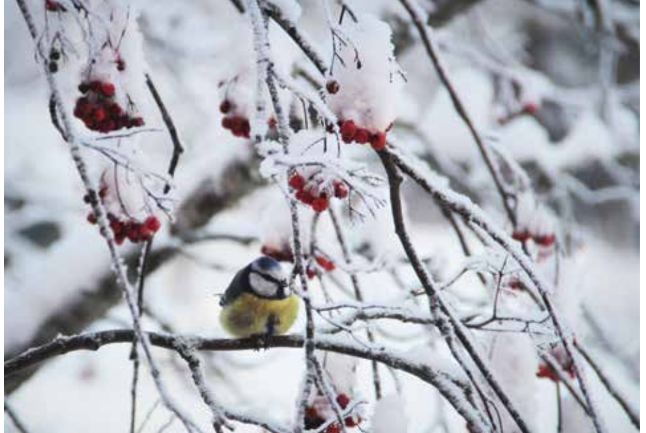
Siniitiainen oli vuoden 2022 selvityksessä yksi runsaimmista pesimälajeista.

Vuoden 2022 pesimälinnustokartoituksessa havaittiin yhteensä 40 pesiväksi tulkittua lajia. Yleisohavaintoja pesimäkaudella tehtiin myös pikkutukasta, jonka voidaan olettaa pesineen selvitysalueella aiempien vuosien tapaan. Lisäksi Keski-Suomessa yleinen lehtokurppa saattaa pesiä alueella, vaikka lajia ei havaittukaan laskento-