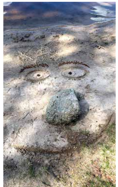
Jypaon teemapäivänä tehtiin muun muassa luontotaideteoksia Köhniönjärven rannalle.

Vuoden vaihduttua kutsuimme tammi-kuisena iltapäivänä opiskelijoiden lähipiiriä tutustumaan opistoomme. Ryhmissä oli tarjolla opiskelijoiden ideoimia ja valmistamia suolaisia ja makeita maistiaisasia sekä ohjelmaa. Bin-