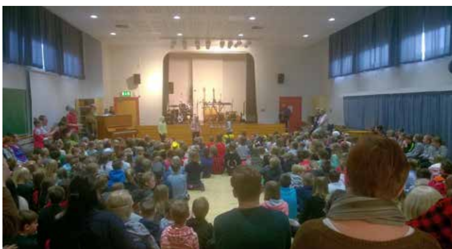
Tärkeä osa koulun arkea: päivänavausten kaltaiset yhteiset hetket pikkusalissa loivat entisen rehtorin Timo Knuuttilan mukaan yhteisöllisyyttä.

koululainen saa vahvan perustan koko kouluaajalle, jolla useimmat kokevat myös mutkia ja alamäkiä.