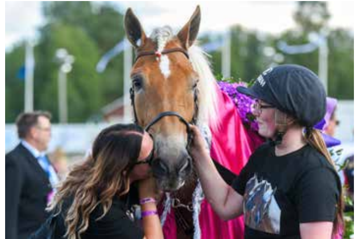
Kuninkuusravit järjestetään Jyväskylässä 26.–28. heinäkuuta.

Lähialueen asukkaille Kuninkuusravit voivat tuoda mah-