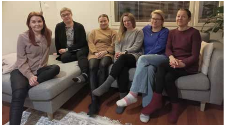
MLL Köhniö-Kypärämäen hallitus.

Perhekahvila kokoontuu kerran viikossa, ja vetäjänä toimii vapaaehtoinen. Vetäjän tärkein tehtävä on toivottaa tulijat tervetulleiksi ja suunnitella