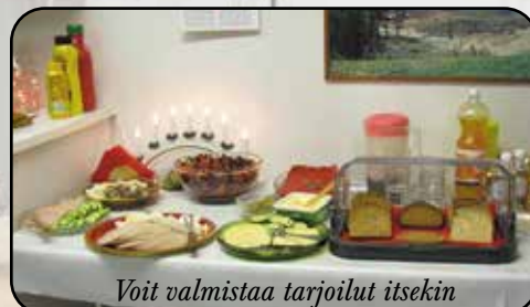
Voit valmistaa tarjoilut itsekin