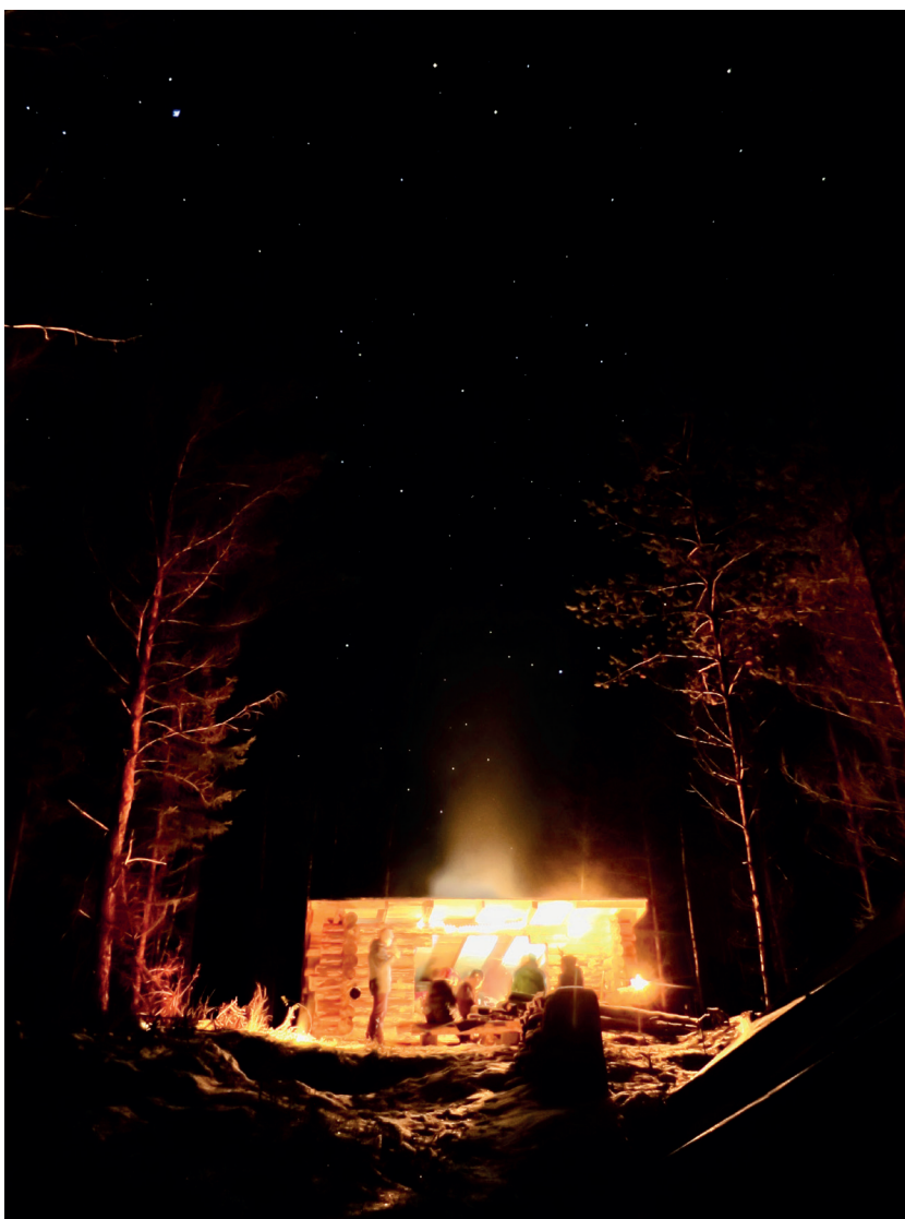
Talviretkellä ohjelman pääsisältö on selviytymisessä, mutta aina on myös aikaa katsella tähtiä.

Ryhmä kokoontuu lukuvuoden 2020-2021 ajan omissa kokouksissa ja retkillä. Vartion oman toiminnan lisäksi uudet aikuiset osallistuvat resurssiensa mukaan myös lippukunnan yhteiseen toimintaan sekä alueellisiin, kansallisiin ja kansainvälisiin partiotahtumiin. Talvella 2021 horisontissa siintää Hile, puolen Suomen talvijamboree, eli Järvi-Suomen partiolaisten, Lapin partiolaisten ja Pohjanmaan partiolaisten yhteinen talvileiri. Mutta mitä sen jälkeen? Mitä aikuinen tekee partiiossa?