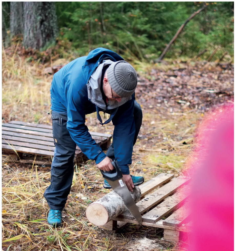
Retkellä aikuisen tehtävät liittyvät retken järjestämiseen, kuten muonitukseen tai huoltoon.