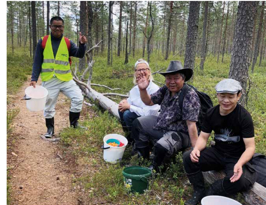
Leivonmäen hillasoilla 2020, vasemmalla Myanmarin Mireh.

vin. Isä on ollut kiinalaisessa ravintolassa töissä ja tehnyt myyntiin mm. erinomaisia kevätrullia. Hän toi leivonnaisiaan maisteltaviksi Köhniön rantajuhlaan tänä vuonna.